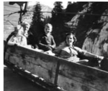
Personentransport mit Montagebahn

Anlagewerte Bahn 6'886'000 Fr. Nebenbetriebe 105'268 Fr. Skilift 572'837 Fr.