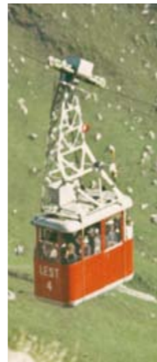
Bahn II. Sektion 1969

Geld für die Nebenbetriebe war keines vorhanden.