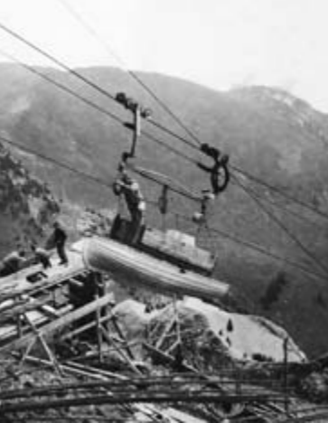
Spezialtransporte bis Stockhorn