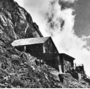
Berghaus Stockhorn, um 1950